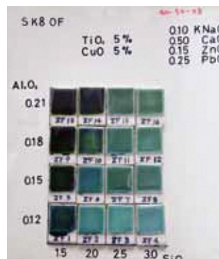
釉薬サンプル台紙