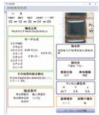
データベースの出力画面